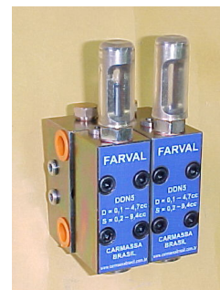
DISTRIBUIDOR MODULAR DDN e DDNM - FARVAL